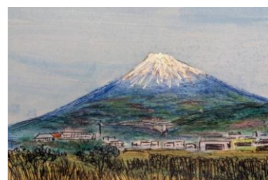
重村 仁ワイズ (西宮クラブ) 作