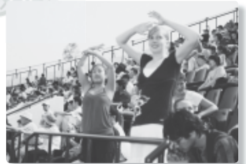
スカイマークスタジアム 7/11