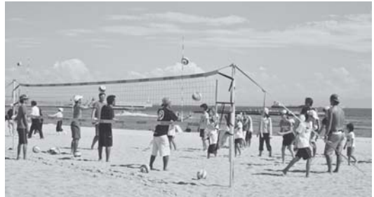
須磨ビーチフェスティバル 9/11(日) 須磨区地域スポーツクラブ、須磨区役所、神戸市体育協会等との協働で浜辺のスポーツ体験などを行いました。