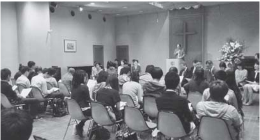
専門学校日本語学科入学式 10/6(木) 神戸YMCA学院専門学校日本語学科の入学式を行いました。新入生の皆さん、ご入学おめでとうございます。ようこそ日本へ!!ようこそ神戸YMCAへ!!