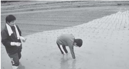
神戸YMCAサポートプログラム おこめ部 三田にある農家の方のご協力をえて、田植えから刈り入れまで1年をかけて田んぼの世話をしています。このプログラムを通して食への関心、就農への関心を育てることが出来ればと願っています。