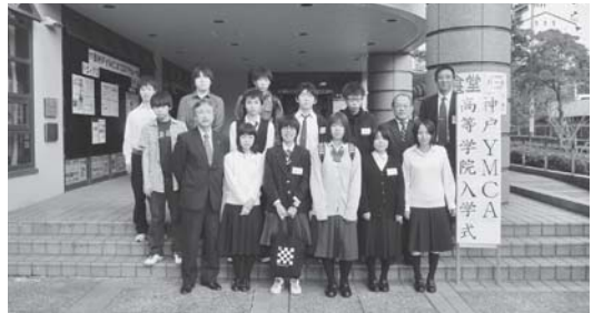
高等学院入学式 10/6(木) 秋晴れの下、12名を迎えて後期入学式を行いました。卒業に向けて一歩一歩確実に進んでほしいと願っています。