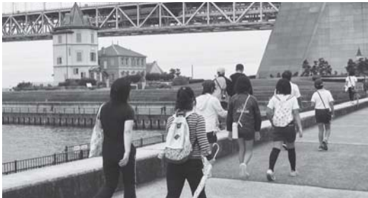
たるみ健康いきいきウオーク2011 10/15(土) 区民スポーツの日に203名の参加者が集まり、神戸マラソンのコースを含む垂水区内を交流しながら歩きました。