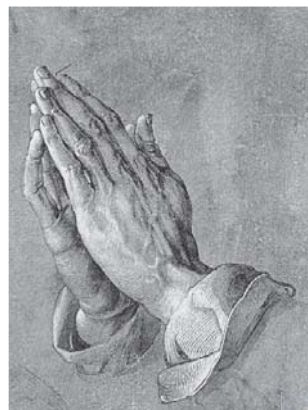
(デューラー「祈りの手」)

11月13日からの一週間は世界YMCA/YWCA合同祈禱週として、世界中で一つのテーマを学び、祈りを合わせます。世界が豊かになって、知識が増え、便利で快適になりましたが、それでも私たちは弱い存在で、自分を越えた、人間を越えた「何か」が必要なのではないのでしょうか。子どもたちに倣って、胸に手を合わせてみませんか？